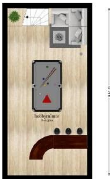
De Acacia 22 - Didam Kelder

De plattegrond is niet geprojecteerd voor eventuele doelindes en ter informatie. Aan de plattegrond is te zien voor welke werken wij staan.