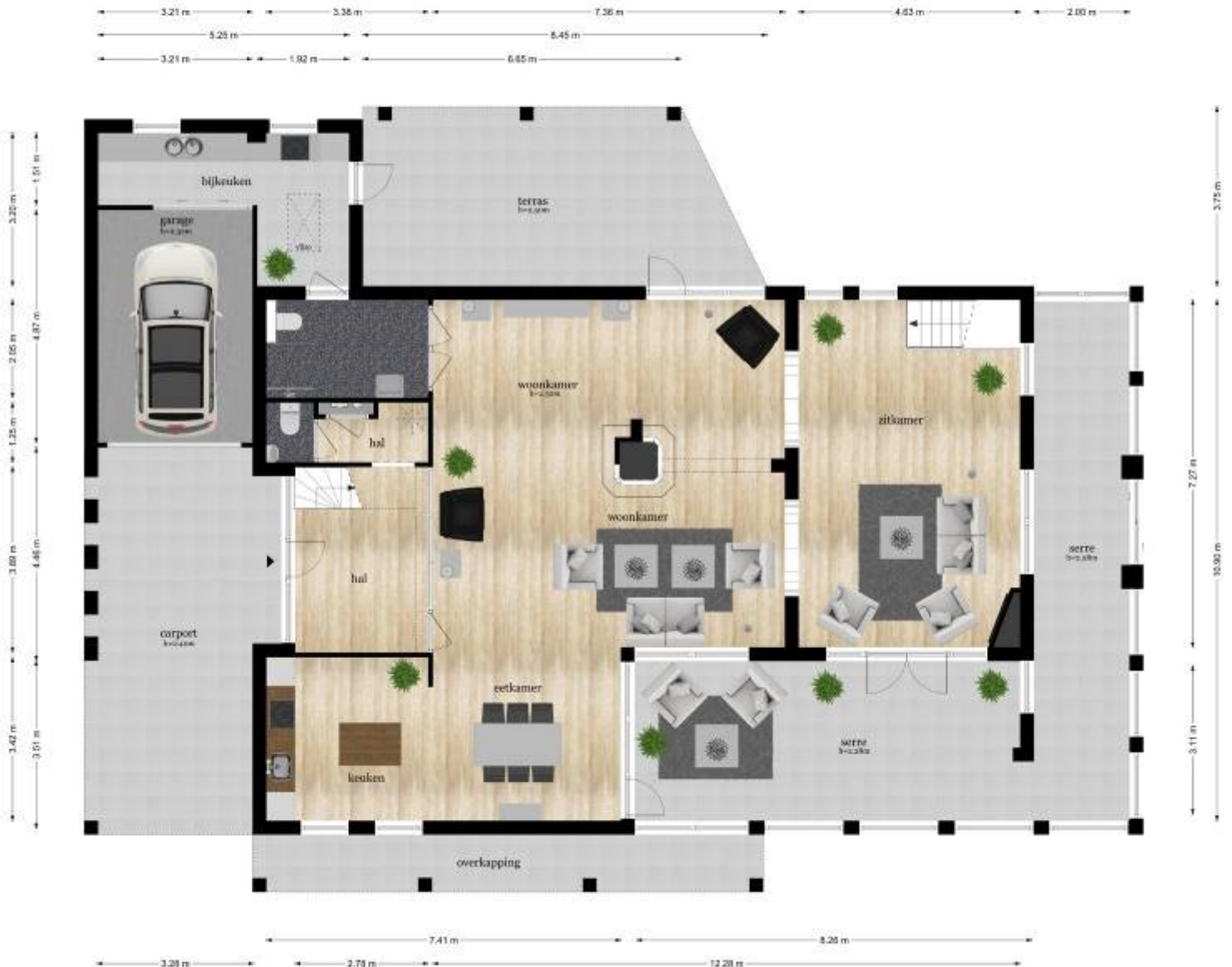
De Acacia 22 - Ddam Begane Grond

De plattegronden zijn geproduceerd over presentatiefoto's door de architect. Aan de plattegronden kunnen geen rechten worden ontleend. © www.vrijverbouw.nl