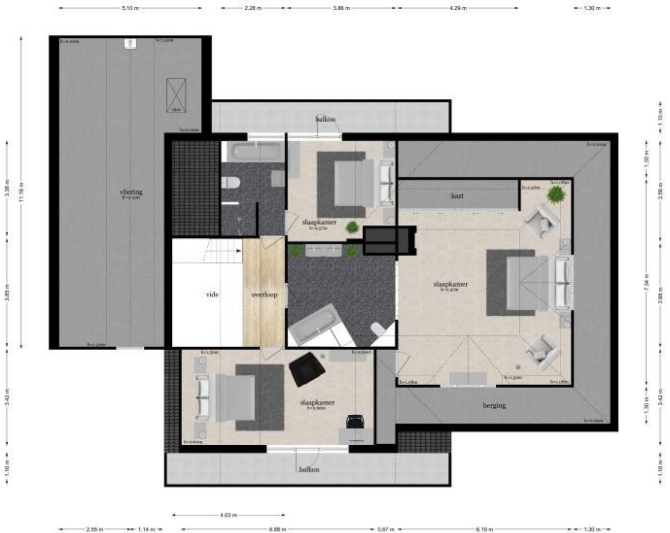
De Acacia 22 - Didam Eerste Verdieping

De plattegrond is een product van een gemeenschappelijke aanbesteding en is bedoeld voor de afbouw van de woning. Aan de plattegrond is te zien welke gemeenschappelijke ruimtes er zijn.